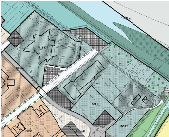
ESTRATTO REGOLAMENTO URBANISTICO